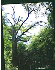
≡ Chêne des Forts

• Sentiers botaniques et sentiers thématiques Maison de la Rance : 02 96 87 00 40