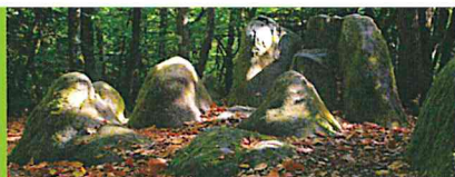
≡ Le Rocher Durand