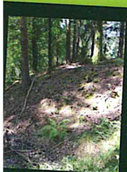
≡ Motte féodale