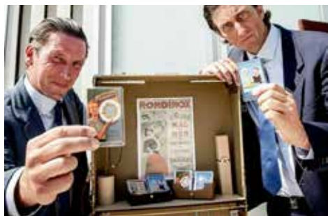
RONDINOX - Cie Mister Alambic Vous sentirez la différence !