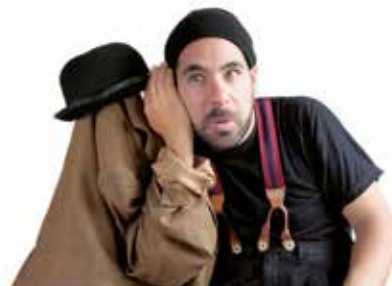
GROMIC - THE MAGOMIC SHOW Cie Visual Comedy - La tendresse du rire