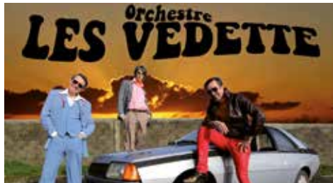
LES VEDETTE - Cie Une de Plus Bal populaire débridé

La 18 e édition des Esclaffades se déroulera les 27 et 28 juin. Un festival pour passer un week-end de rires, de petits et grands bonheurs à partager en famille avec une programmation renouvelée, des artistes de grand talent venant des 4 coins de la France et pour certains de l'étranger. Pour attiser votre curiosité, nous vous dévoilons en exclusivité quelques spectacles de la programmation !